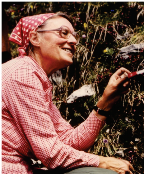
Bei der Alpenexkursion 1980.